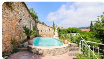
Gîte la Roseraie