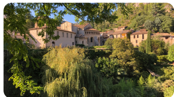
St Guilhem le Désert