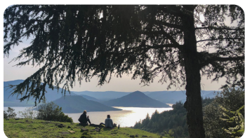
Lac du Salagou